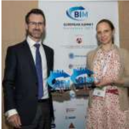
1r EBS Award entregado a UE y EU BIM Task Group